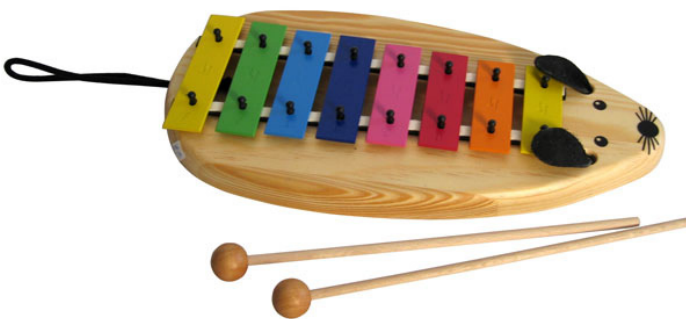
PEGL100 Maus 8 Töne

Glockenspiele sind beliebte und einfach zu erlernende Musikinstrumente für Kinder. Sie bieten die Möglichkeit, schnell einfache Melodien zu spielen und sich mit den Noten vertraut zu machen. Selbst ganz kleine Kinder sind von den feinen glockenhellen Tönen begeistert und klöppeln munter drauf los, sobald sie einen Schlägel in der Hand haben.