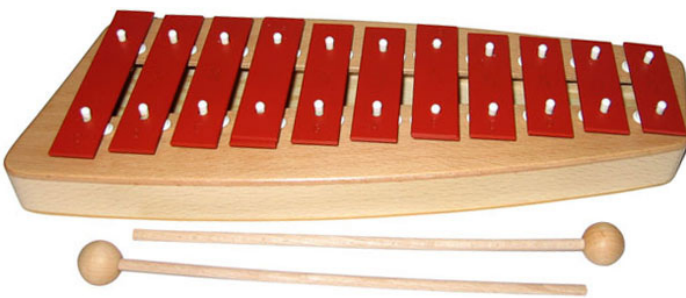
PEGL110 NG-10 11 Töne