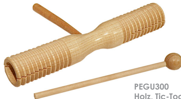
PEGU300 Holz, Tic-Toc

Die kubanische Musik ist reich an Percussionsinstrumenten; das Guiro gehört dazu. Traditionell aus einem ausgehöhlten Kürbis hergestellt, hat das Guiro eine von der Natur vorgegebene Form, die ihm ein exotisches Aussehen verleiht. Oft ist es noch mit gebrannten Mustern verziert oder bemalt. Die Oberfläche des Guiros ist gleichmäßig gekerbt, damit man mit einem Holzstab darüber ratschen kann.