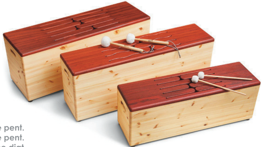
PEST200 6 Töne pent. PEST201 8 Töne pent. PEST202 12 Töne diat.