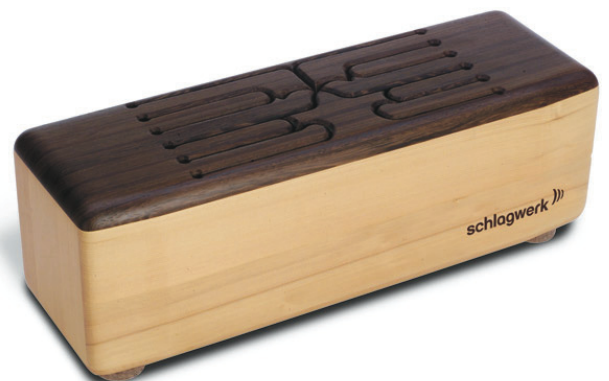
PEST203 10 Töne, Wenge, 60x20x18