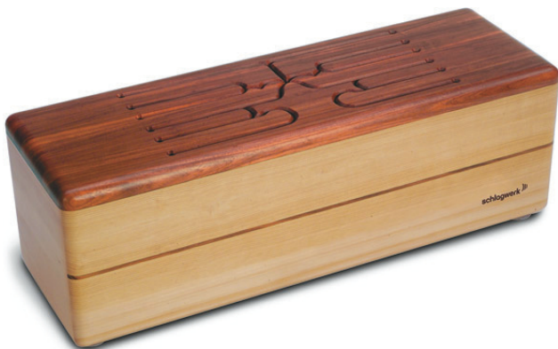
PEST204 Big Bom, Mahagoni, 100x35x35