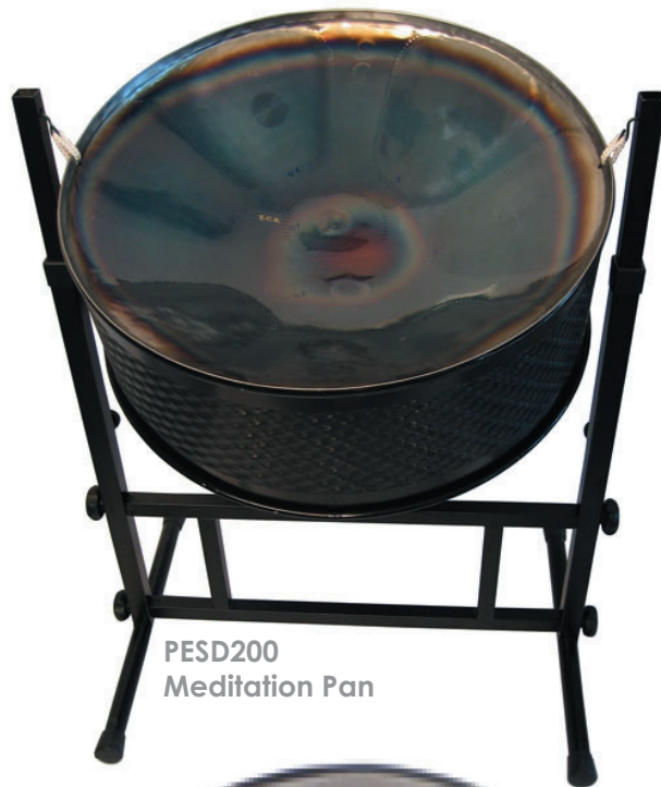
PESD200 Meditation Pan