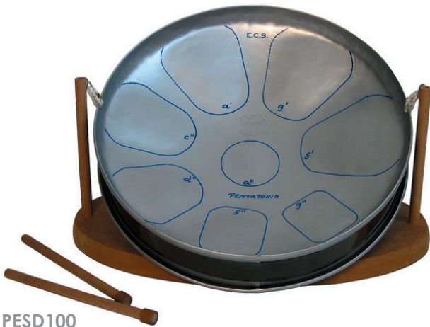
PESD100 Kid pentatonisch 7 Töne