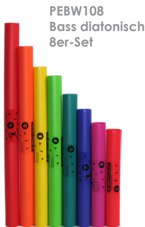
PEBW108 Bass diatonisch 8er-Set