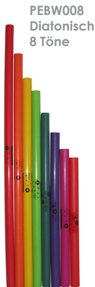
PEBW008 Diatonisch 8 Töne