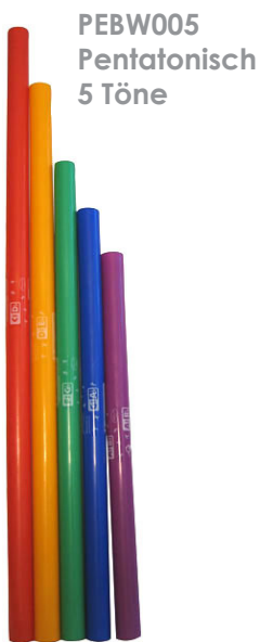
PEBW005 Pentatonisch 5 Töne