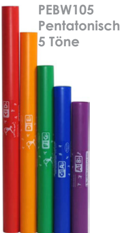
PEBW105 Pentatonisch 5 Töne