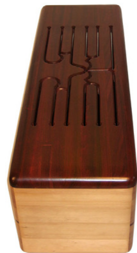
PEST300 Big Bom pentatonisch 10 Töne