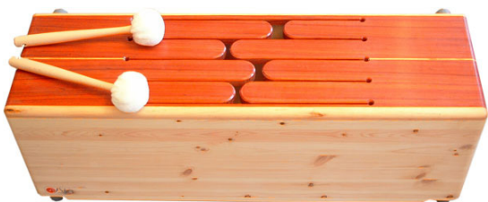
PEST200 Gross Tom