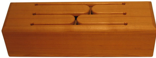
PEST104 Tepo 4 Töne inkl. 2 Schlägel